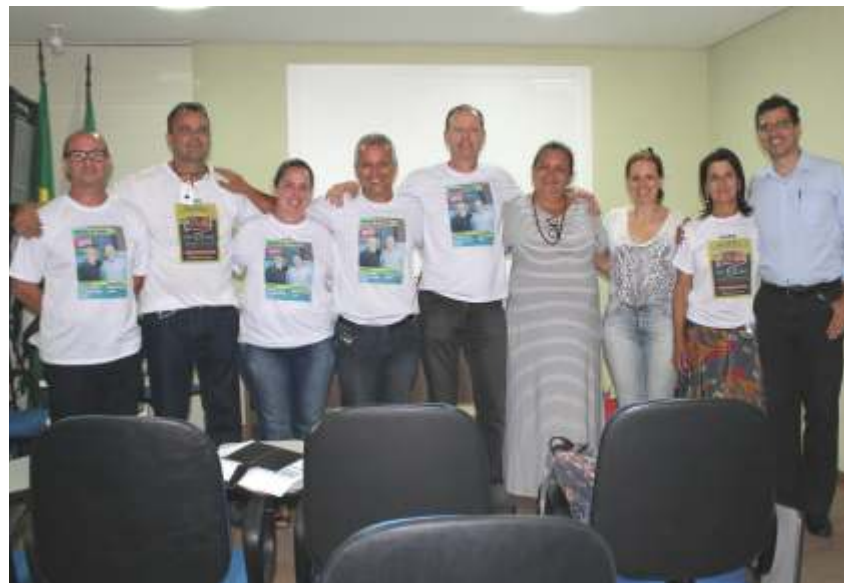
Vencedores tomarão posse no primeiro dia útil de fevereiro de 2020

Todos tomarão posse no primeiro dia útil de fevereiro de 2020. O mandato seguirá até dezembro de 2022.