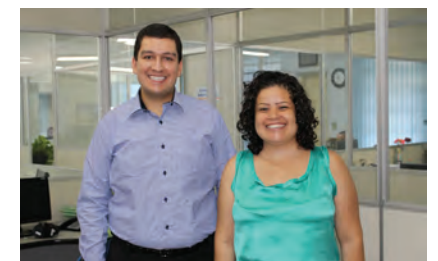
Economista e escriturária contratados, através de concurso público.

Os servidores do Instituto participaram de diversos cursos e congressos técnicos visando o aprimoramento e atualização profissional. Dentre eles destacamos: o e-social, cursos de Contabilidade Pública, Patrimônio, Investimentos, Aposentadoria Especial, Audesp, Assuntos Previdenciários, entre outros.