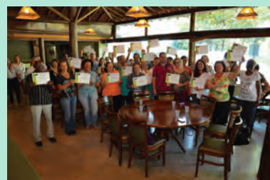
IPASP inclui digitalmente cerca de 300 alunos da Melhor Idade Página 03