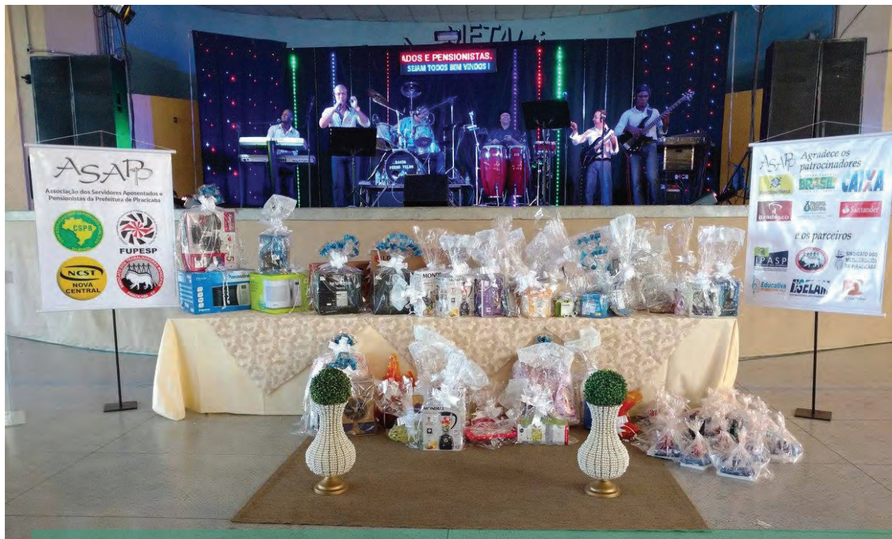
Cerca de 500 pessoas prestigiaram o evento.

Um dos maiores eventos realizados no Brasil, voltado para aposentados e pensionistas, foi promovido pela Asapp (Associação dos Servidores Aposentados e Pensionistas de Piracicaba) no dia 20 de maio: o 7º Encontro de Aposentados e Pensionistas de Piracicaba. Com o apoio do Sindicato dos Trabalhadores Municipais de Piracicaba e Região e do Iasp (Instituto de Previdência e Assistência Social dos Funcionários Municipais de Piracicaba), além de vários patrocinadores, o evento ocorreu no salão recreativo do Sindicato dos Metalúrgicos de Piracicaba.