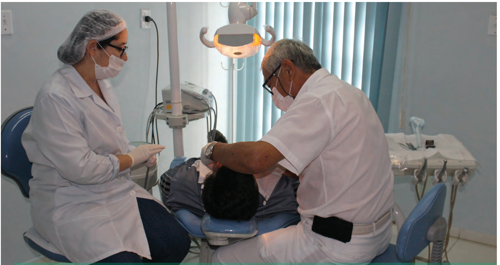
Convênio SIM oferece atendimento odontológico, terapêutico e ambulatorial.

Podem ser feitos pelos telefones: (19) 3437-9877 ou (19) 3437-9870. Para mais informações acesse www.ipasppiracicaba.sp.gov.br/Sim.php