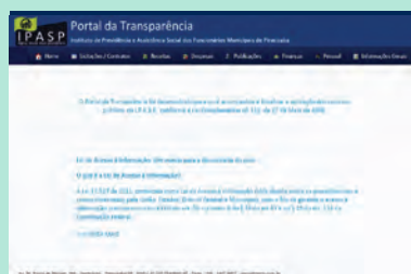
IPASP inaugura o Portal da Transparência Página 03