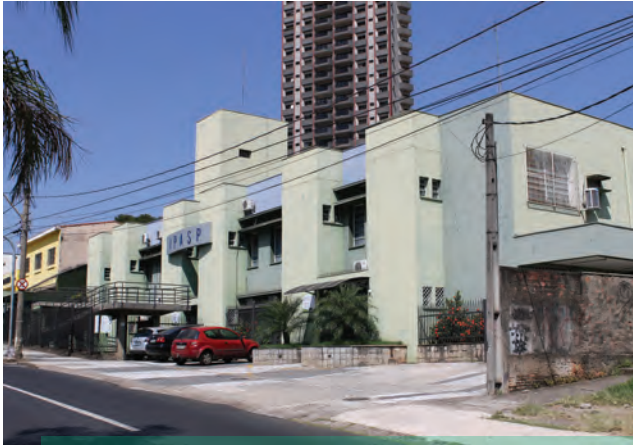
Antiga fachada do IPASP