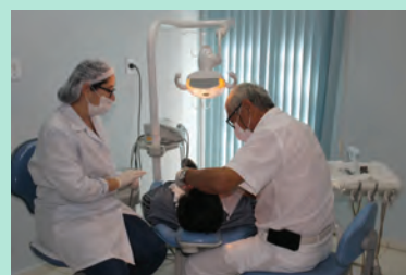
Convênio SIM supera 60 mil atendimentos durante o triênio 2014/2016 Página 11