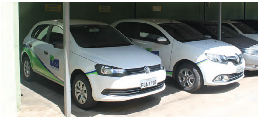
Compra de dois carros 0km

Através de parcerias, reformulamos o curso de informática, através de: novos computadores; contratação de professor com perfil para o público da melhor da idade; aquisição de ar condicionado; instalação de tela e projetor de imagem; nova iluminação da sala de aula, proporcionando assim, um melhor ambiente educacional. Oferecemos três módulos de ensino com 60 vagas por semestre, e realizamos 5 formaturas.