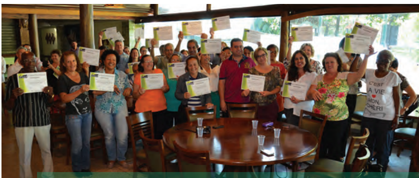
Formatura dos alunos da Melhor Idade.

No dia 3 de agosto de 2016, o IPASP (Instituto de Previdência e Assistência Social dos Funcionários Municipais de Piracicaba) deu início à nova modalidade do curso de inclusão digital à melhor idade: o Módulo III – interatividade. Nesta etapa, os aposentados e os pensionis-