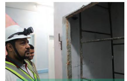
Instalação do elevador