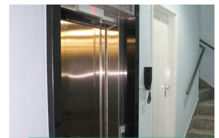
Instalação do elevador concluída